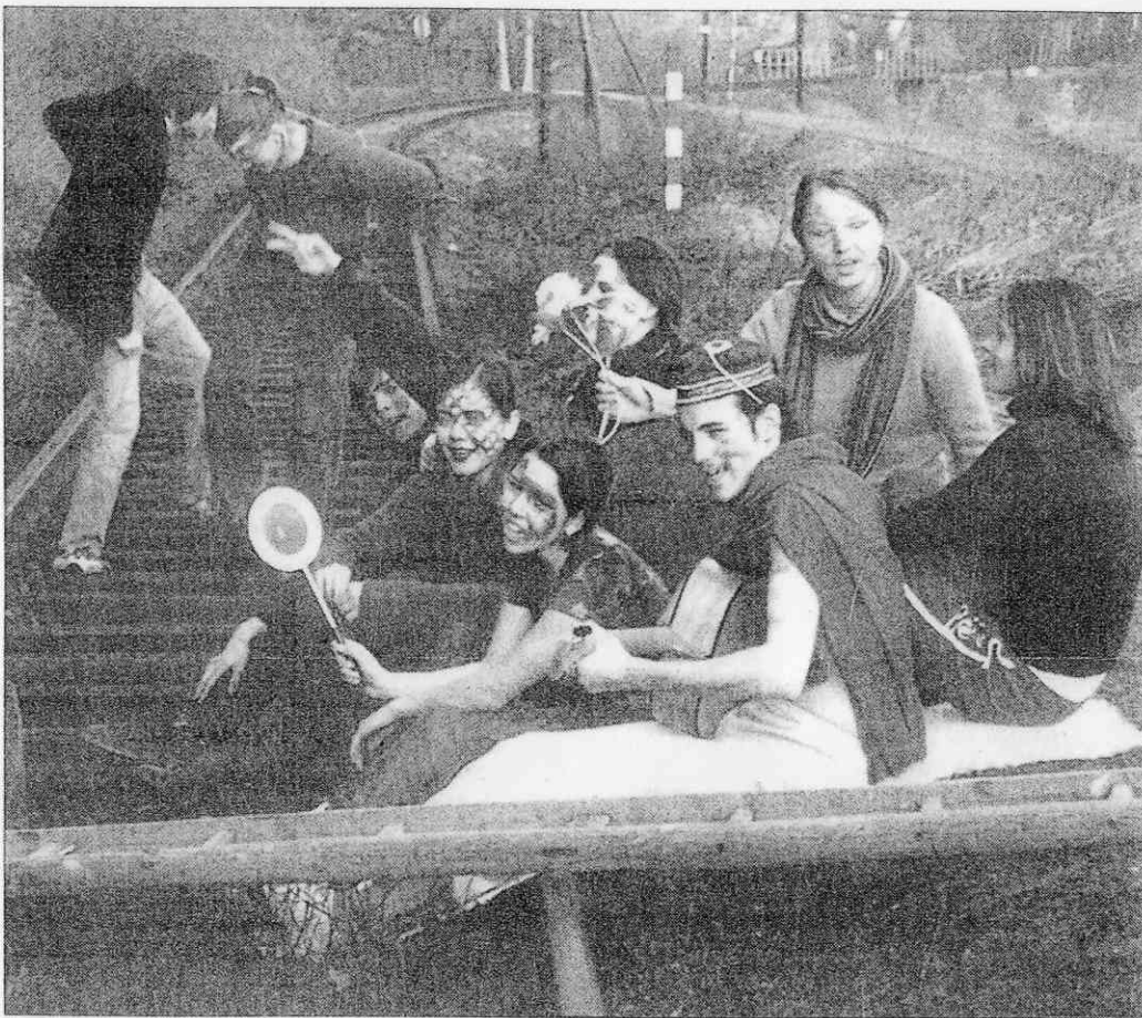
Členové souboru Oldstar na soustředění v kostýmech, ve kterých budou vystupovat ve hře Sen noci svatojánské .

"Bude se hrát po vesnicích a městech. Jsme dopředu domluveni s místními úřady, takže kdyby přišlo, přesune